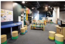
キッズコーナー 水の生き物を調べるための本や資料を多数の用意。コンピューターを使ったフグ、ワニ、クジラのQ&Aなども人気。