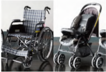
車いす10台常設 ベビーカーA型10台常設