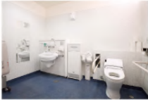
多目的トイレ ※金トイレ簡所(5カ所)に設置 ●大人用ベッド設置(B1/1カ所、2F/2カ所) ●オストメイト対応(B1/1カ所、1F/1カ所、2F/1カ所)