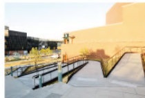
2Fの入口までは、階段以外にもスロープとエレベーターがご用意です。