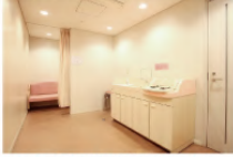
授乳室完備(男性立入禁止) ●おむつ替え台 ●ベビーベッド完備 ※希望者にはミルク給湯あり