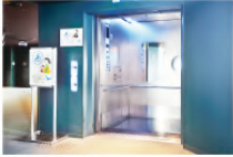
障害者向け館内エレベーター設置