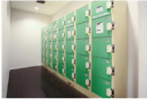
コインロッカー40台 100円リターン式(無料)