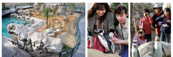
ペンギン村:温帯ゾーン 木道を歩いて回遊するかたちで観察できます。野生地での調査活動の模擬体験や、ペンギンとの記念撮影、ペンギンタッチ、エサやりなどができます(人数制限あり)。

チリ国立サンチャゴ・メトロポリタン公園より「生息域外重要繁殖地」の指定を受けています!! 海響館とチリ国立サンチャゴ・メトロポリタン公園は、互いに協力し、フンボルトペンギン特別保護区で得られた飼育技術などがチリでのフンボルトペンギン飼育下繁殖を支援し、野生地での研究と保全に貢献していくことを約束する国際協定に調印しました。