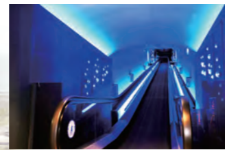
スローペースエレベーターで4Fへ スローペースエレベーターに乗るとそこはもう海の世界。音と映像がより臨場感を表現します。4階に進み、関門海峡のパノラマ水槽からご覧いただけます。