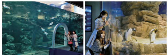
ペンギン村:亜南極ゾーン 水深6m、水量約700トン。ペンギンプールとしては世界最大級です。水中トンネルからは、飛ぶように泳ぐペンギンを見ることができます。