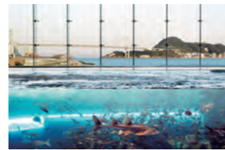
関門海峡潮流水槽(上部) 背景一面に関門海峡が広がるこの水槽では実際の海の中をのぞいているような不思議な世界へみなさんをいざないます。