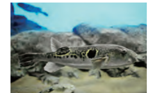
フグの仲間たち 世界中のフグの仲間たち100種類を常時展示しています。