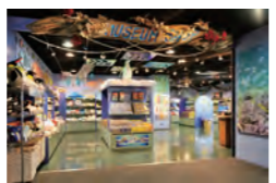
ミュージアムショップ